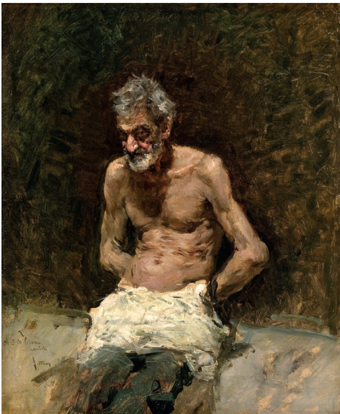
Óleo sobre lienzo [Oil on canvas], 47 × 39 cm Colección de Arte Fundación María José Jove [Fundación María José Jove Art Collection]