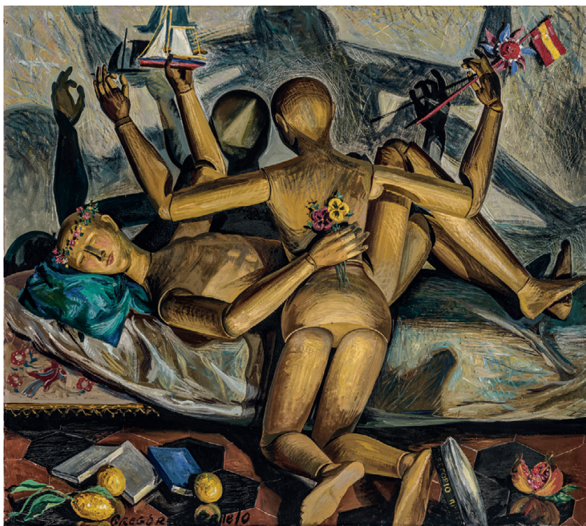
Óleo sobre lienzo [Oil on canvas], 154,3 × 173,5 cm Museo Gregorio Prieto