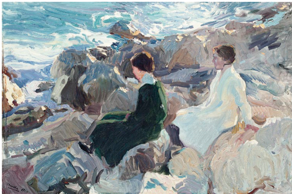
Joaquín Sorolla, La Caleta, Málaga ,

1910. Óleo sobre lienzo, 63,5 × 95 cm. Museo Sorolla, Madrid, inv. 00869